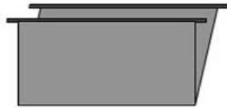
Gambar 5. Folder gantung